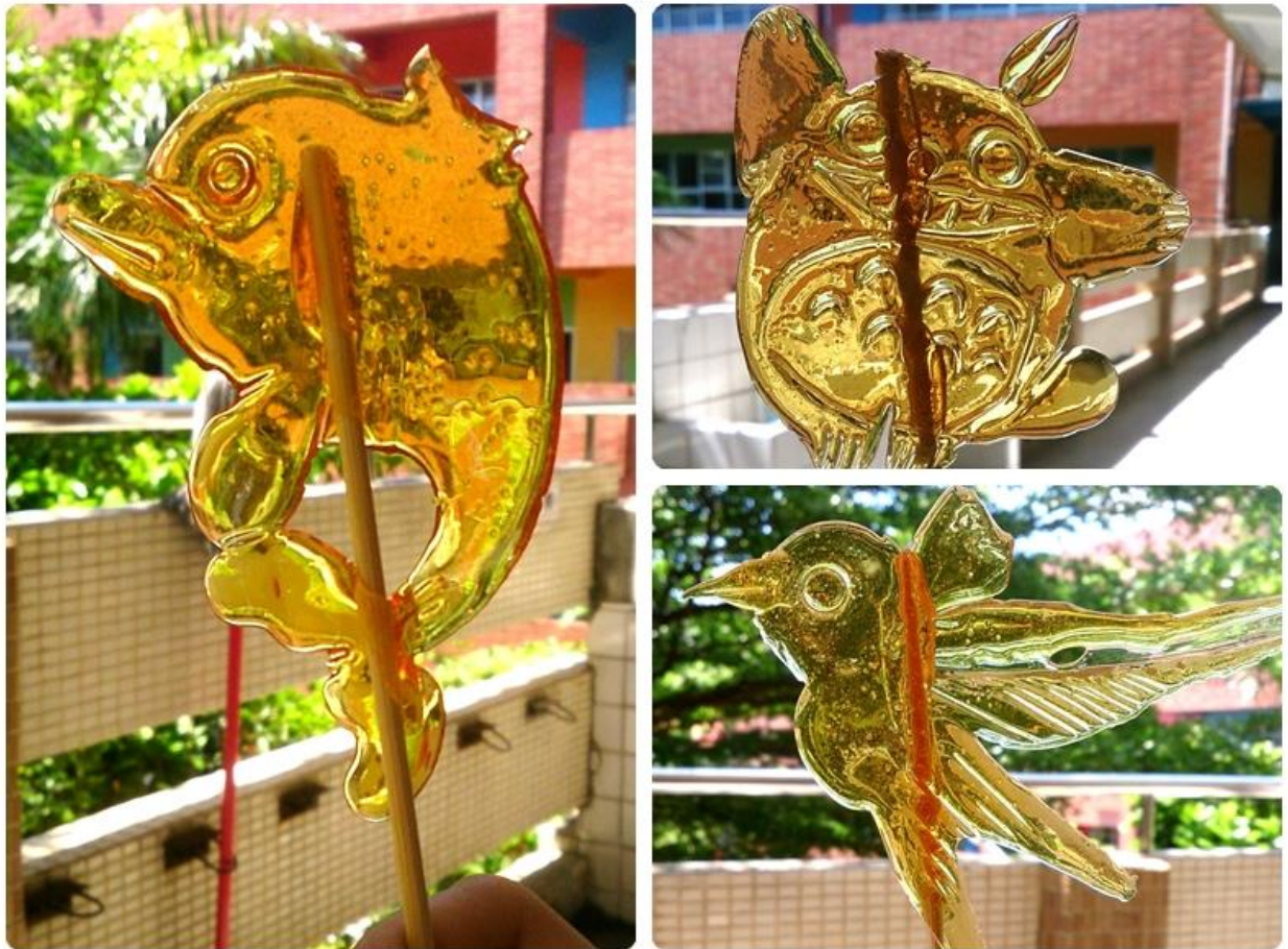
圖九：不同造型的卡通圖案