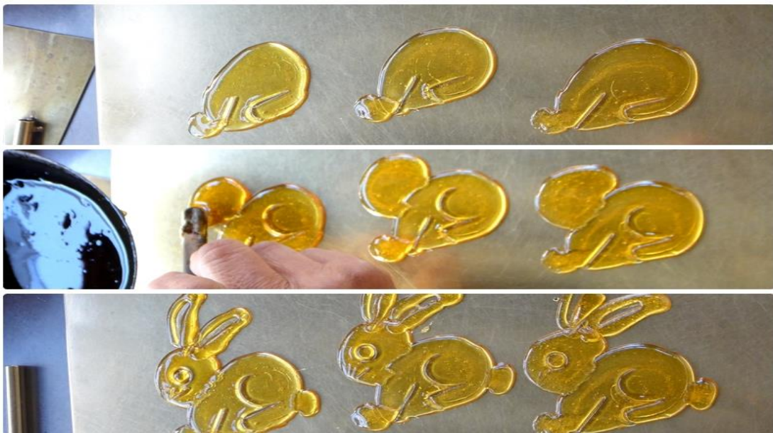
圖八：畫糖步驟依序由上而下

「通常我燒鍋，然後一人鍋子能做六隻小隻的，然後六隻小隻的我會分成前半段和後半段，就是每次先畫三隻(如圖八)，然後好了拿起來，我再把鍋子剩下的一半的糖再加入，然後再畫一次，然後這個因為就是客人來了找錢，第二次加熱加過頭了，加過頭不能畫。如果是夏天綽綽有餘，如果是冬天的話，三支糖果不小心，它馬上就硬了嘛，然後畫好了，可是你要綁起來的時候它會破掉，不小心的時候，時間就是拉得太長了，有時候耽擱了什麼事情就會破掉。」