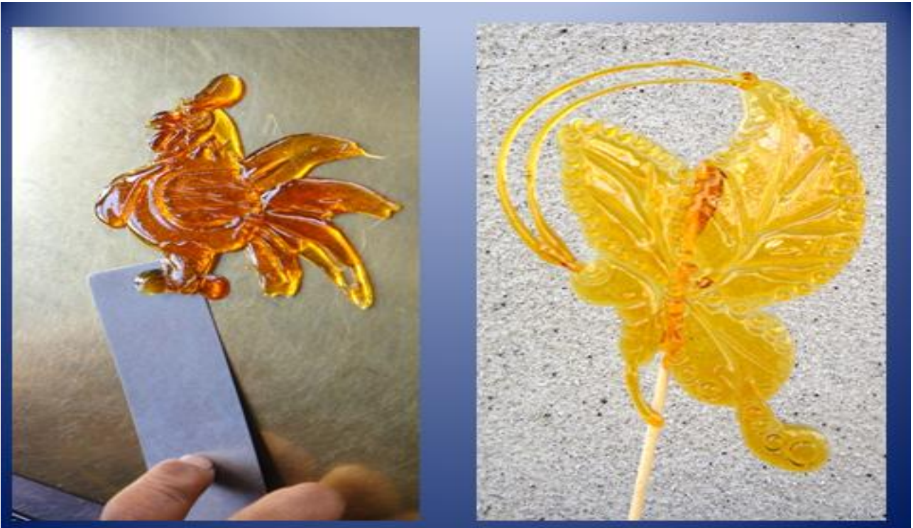
圖五：左圖顏色較深，右圖顏色透明均勻