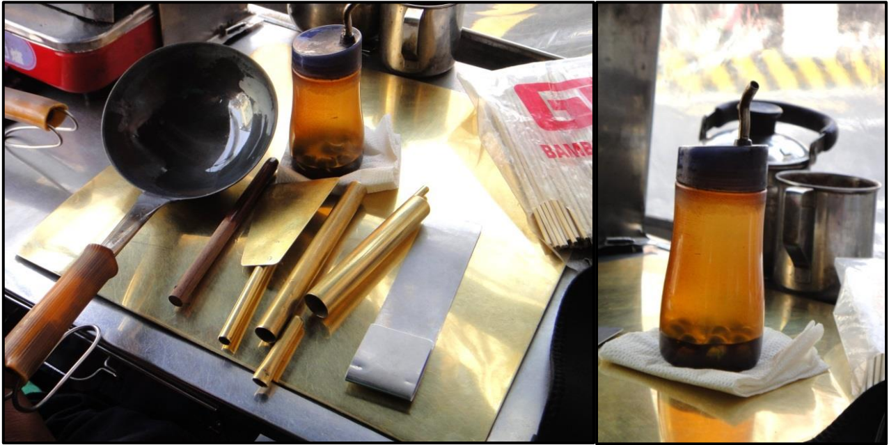
圖四：左圖是畫圖工具，右邊是麻油瓶

「燒糖通常燒到一百六十度，我也不知道有一百六十度，是一個專門製作糖果的人告訴我的，他說糖要燒到水乾掉之前一定要達到一百六十度，它不能超過一百六十度，超過一百六十度以後，水乾掉以後就變成焦糖，啊焦糖就不好吃就苦苦的，焦糖吃起來苦苦的，那淡淡的苦，一點點的苦還可以哦!如果真的很苦根本不能吃，比咖啡還難吃，就是黑黑的，那也不好吃。」