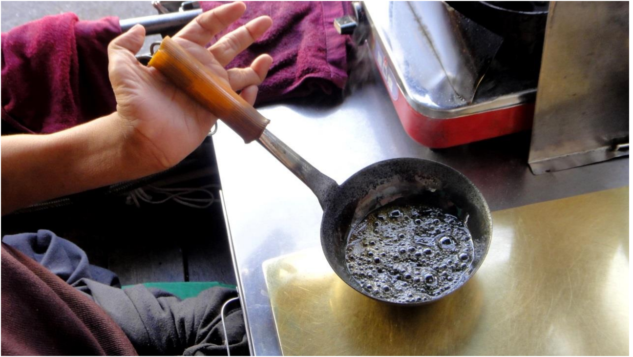
圖六：糖水燒煮溫度到 160 度