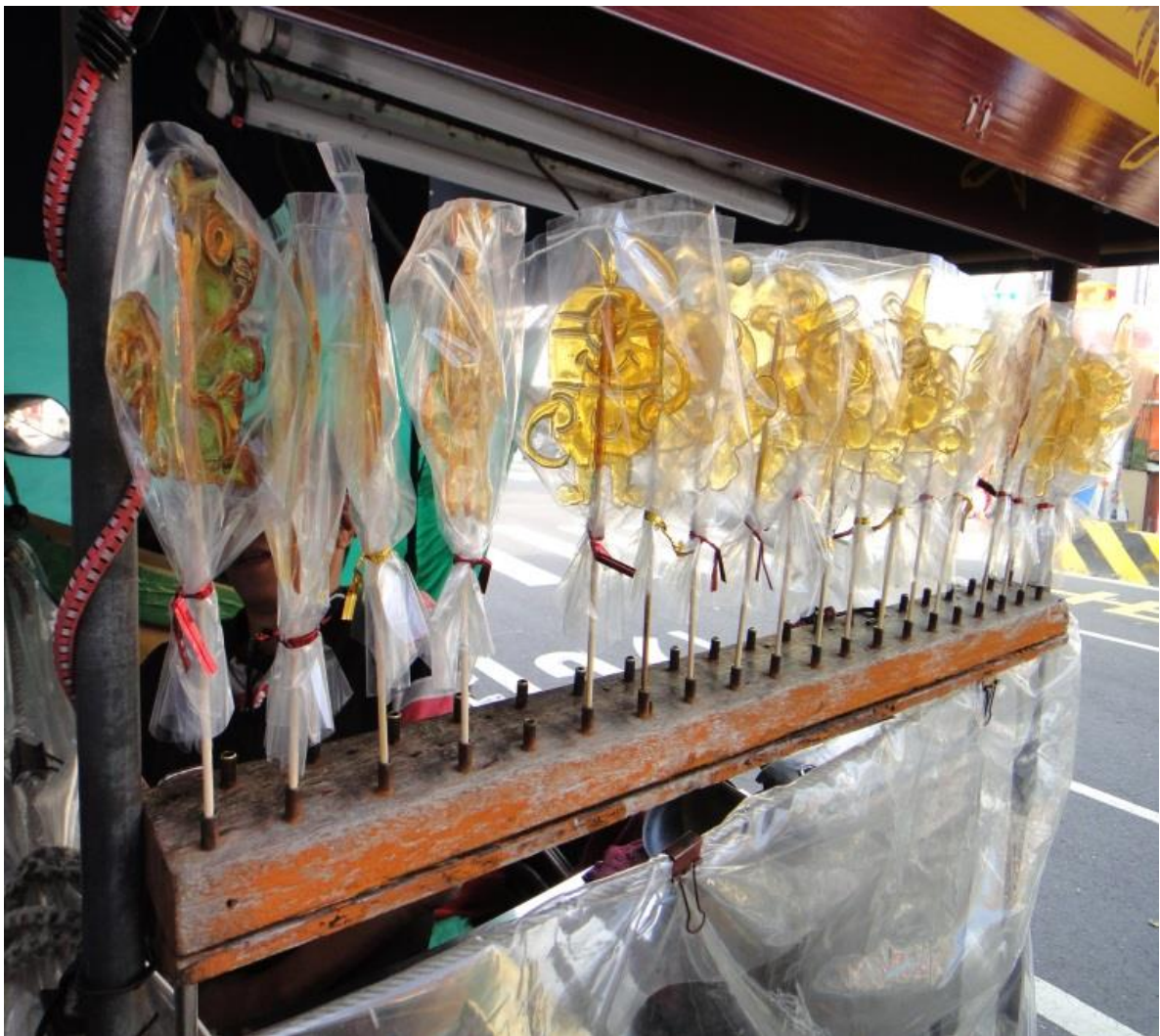
圖十：畫糖裝進袋子保存

「很簡單，把它裝在袋子裡面，綁起來，然後像冬天常溫，可以放五天到六天，都沒有問題，然後如果是夏天的話，大概常溫只能放兩天(如圖十)，還有一個辦法，把它包裝好了，放冰箱冰，冰幾個月都不會壞，有時候客人在夏天會訂製大量的時候，我都這樣做，做好了就給它放冰箱(如圖十一)。」