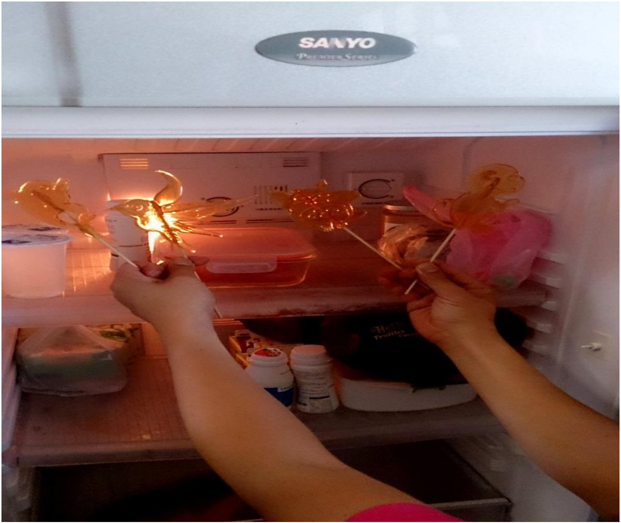
圖十一：畫糖放進冰箱保存