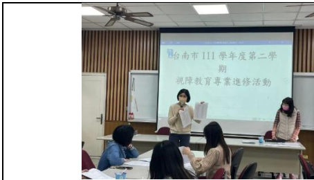
111 學年度下學期工作報告及個案分派