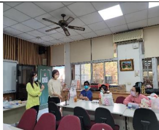
3 月 1 日功能性視覺評估實作(初階)研習