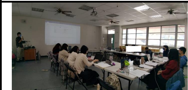
113年2月17日於永福國小辦理視障點字教材轉譯人員研習