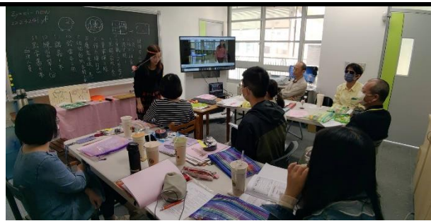
113年3月13日於永福國小辦理功能性應用工作坊研習