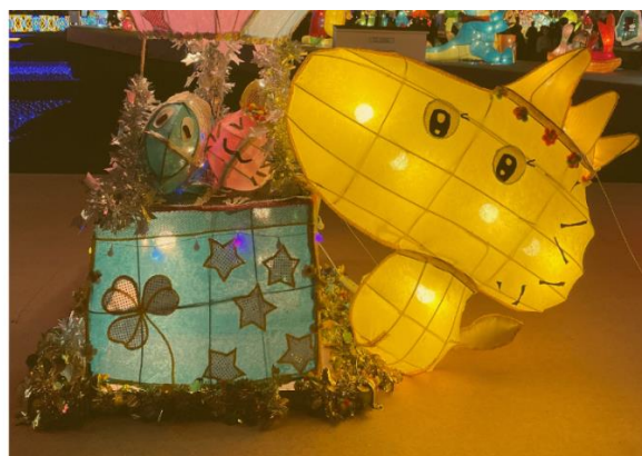
▲永康國小三年級 洪梓祐 。參加 2024 臺灣燈會親子組榮獲展出「夢想」「家」。